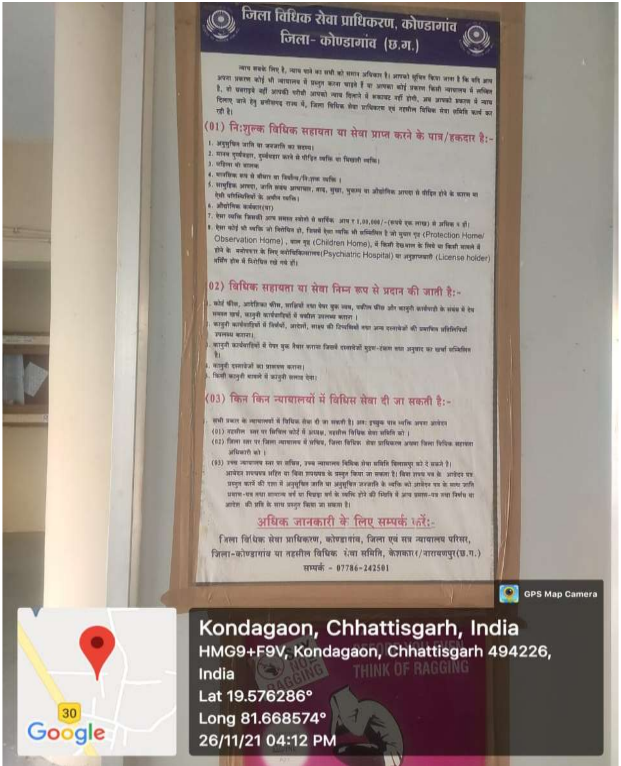
Fig.: Information regarding free legal assistance