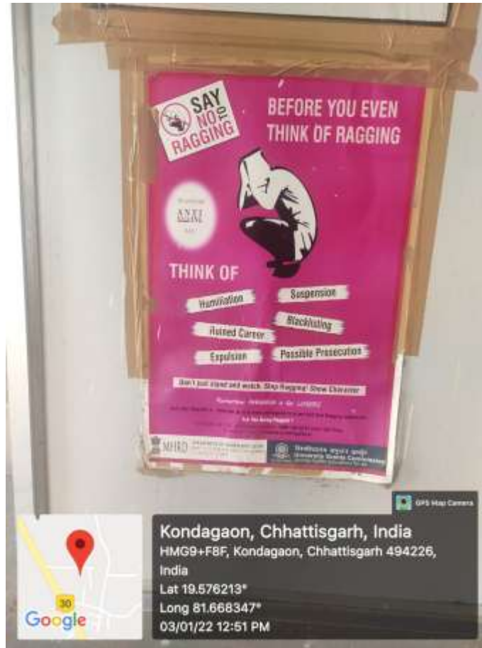
Fig. Anti-Ragging message displayed in campus.