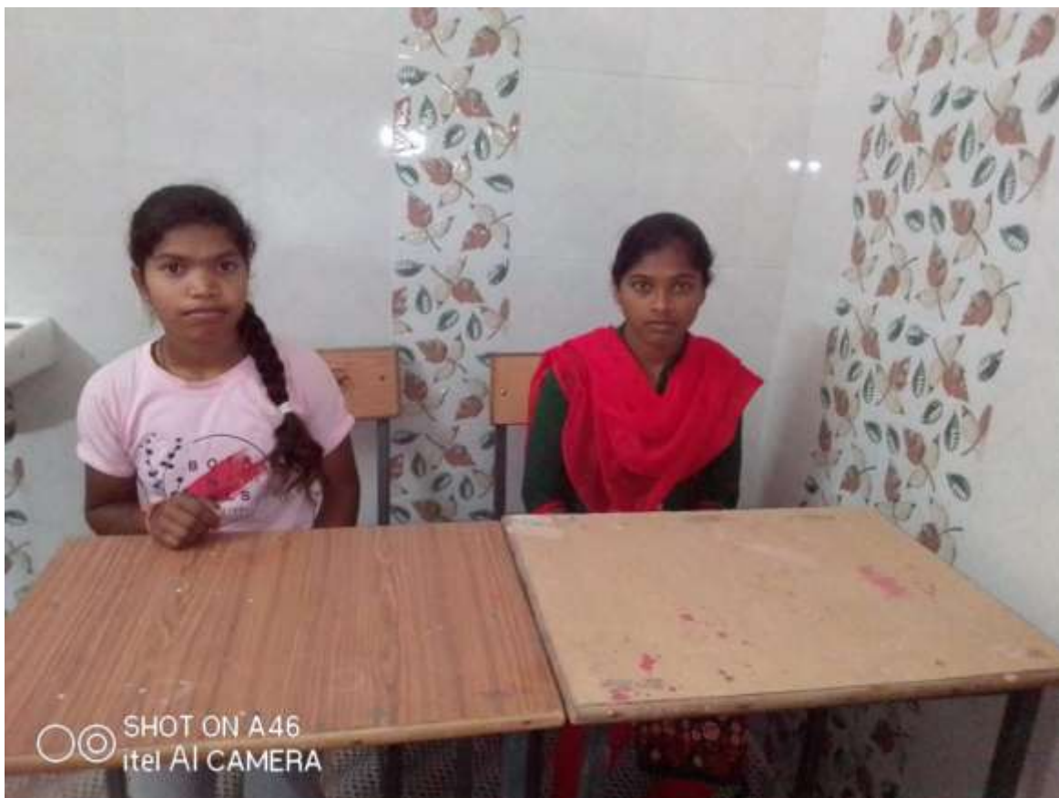
Fig : Girls resting in Girl's Common Room