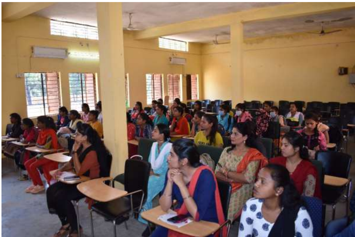
Fig. Staff and students on International Women's Day 2021