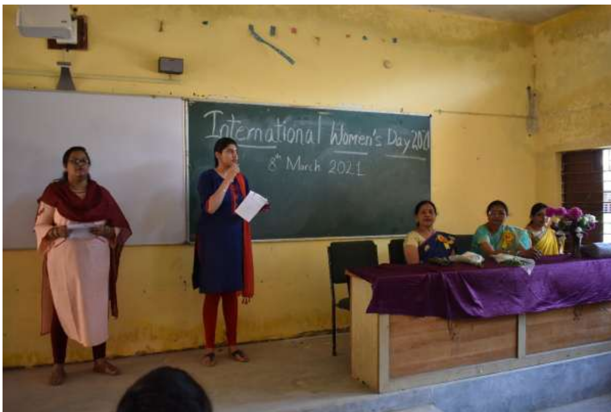
Fig. Teacher addressing girls on International Women's Day 2021