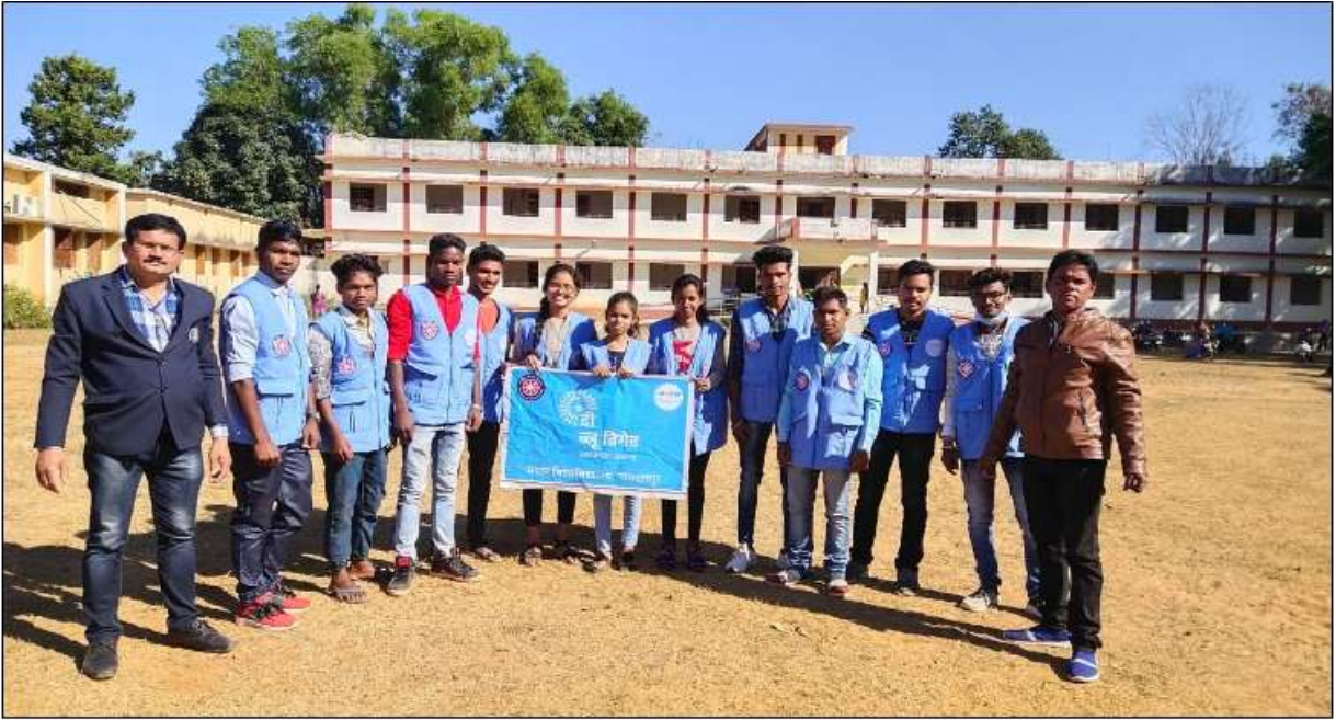
Fig.: Volunteers of Blue Brigade