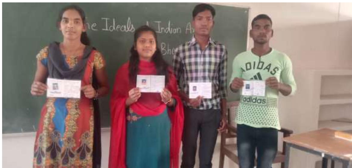
Fig. Students holding their Identity Cards