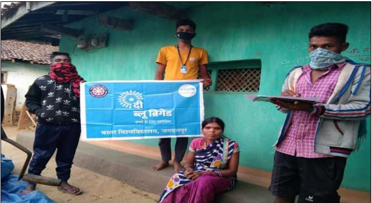
Fig.: Volunteers of Blue Brigade while counselling a woman