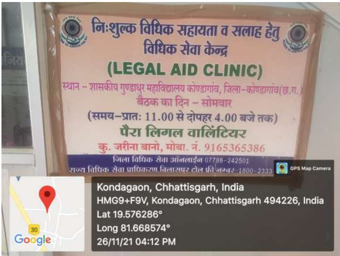
Fig.: Legal Aid Clinic