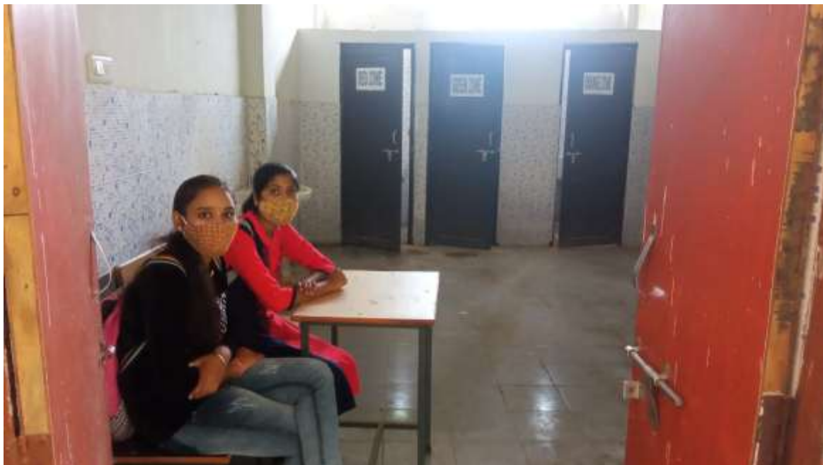
Fig : Girls resting in Girl's Common Room

Keeping the girl's privacy and safety in mind, a Girl's Common Room is established in the campus where washroom is attached with a proper sitting arrangement. The girl's student can spent their time safely in Girl's Common Room when free.