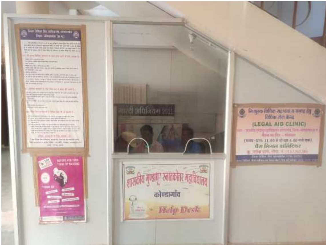
Fig.: Help Desk