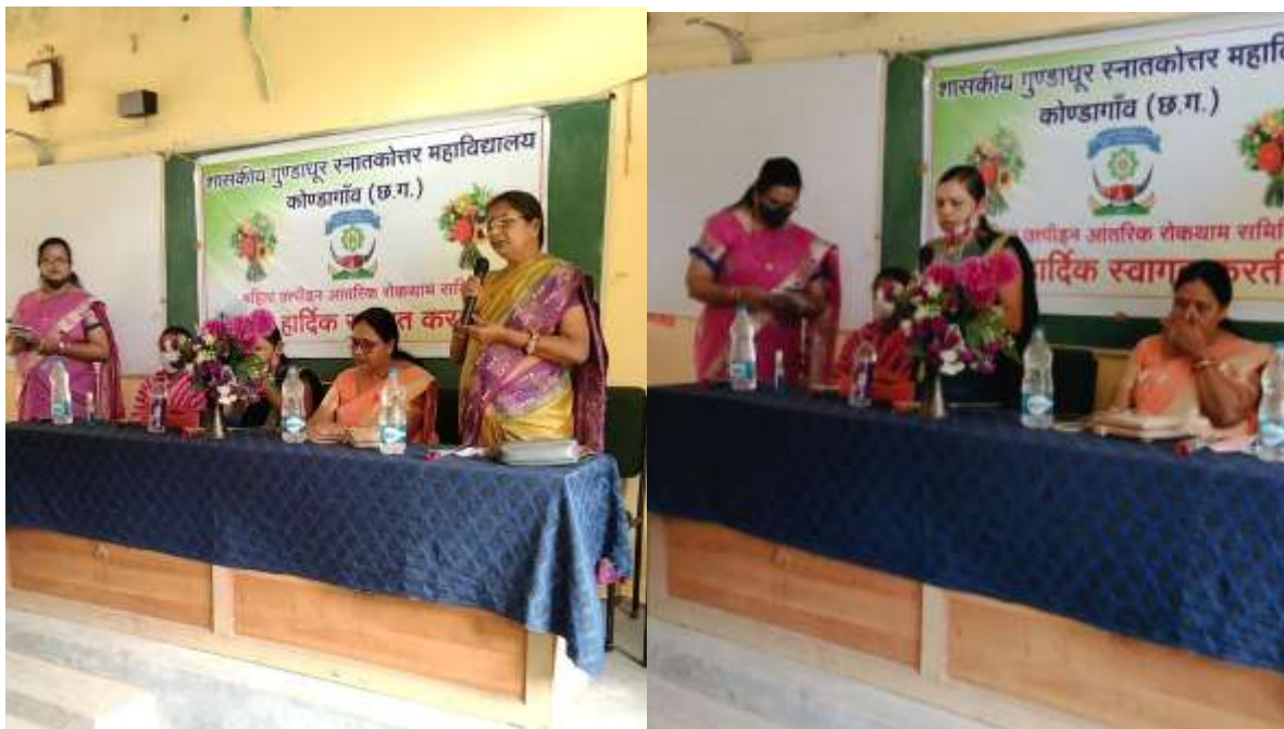
Fig.: Staff and guest during the workshop on Awareness on Women Harassment.