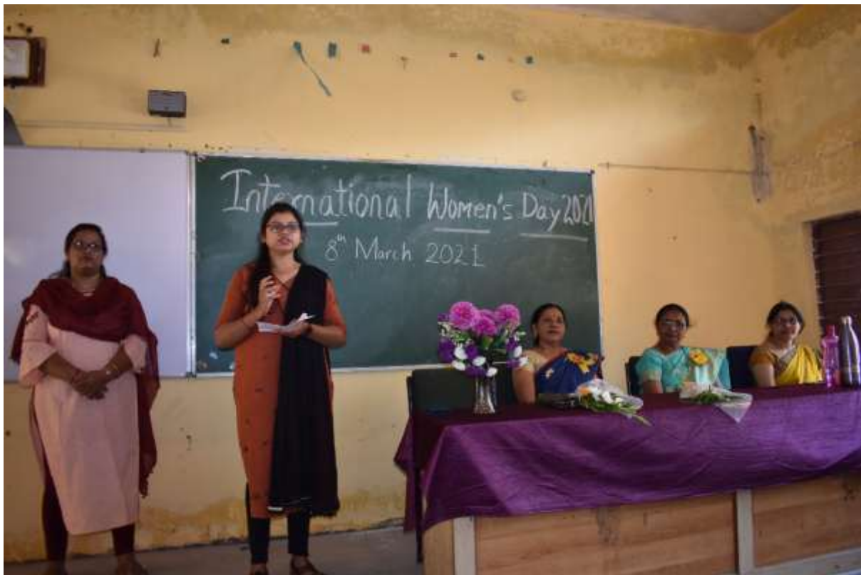
Fig. Teacher addressing girls on International Women's Day 2021