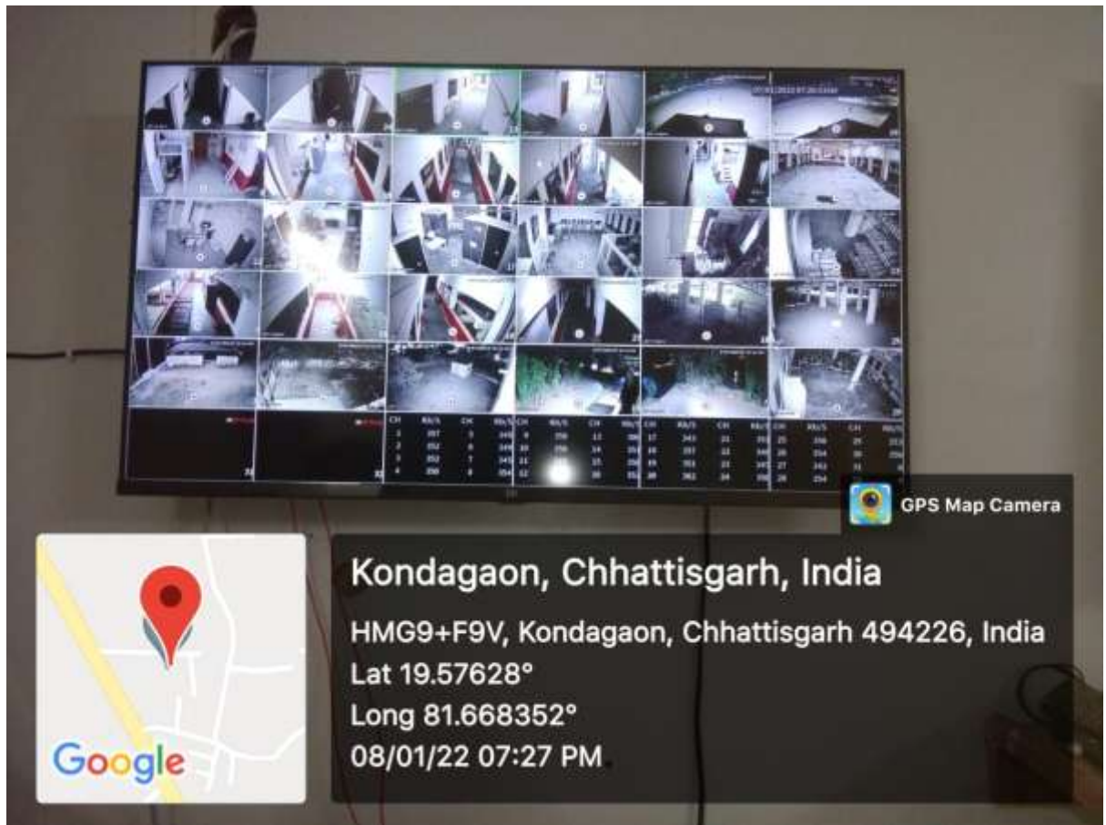
Fig.: CCTV camera monitoring at Principal Room.