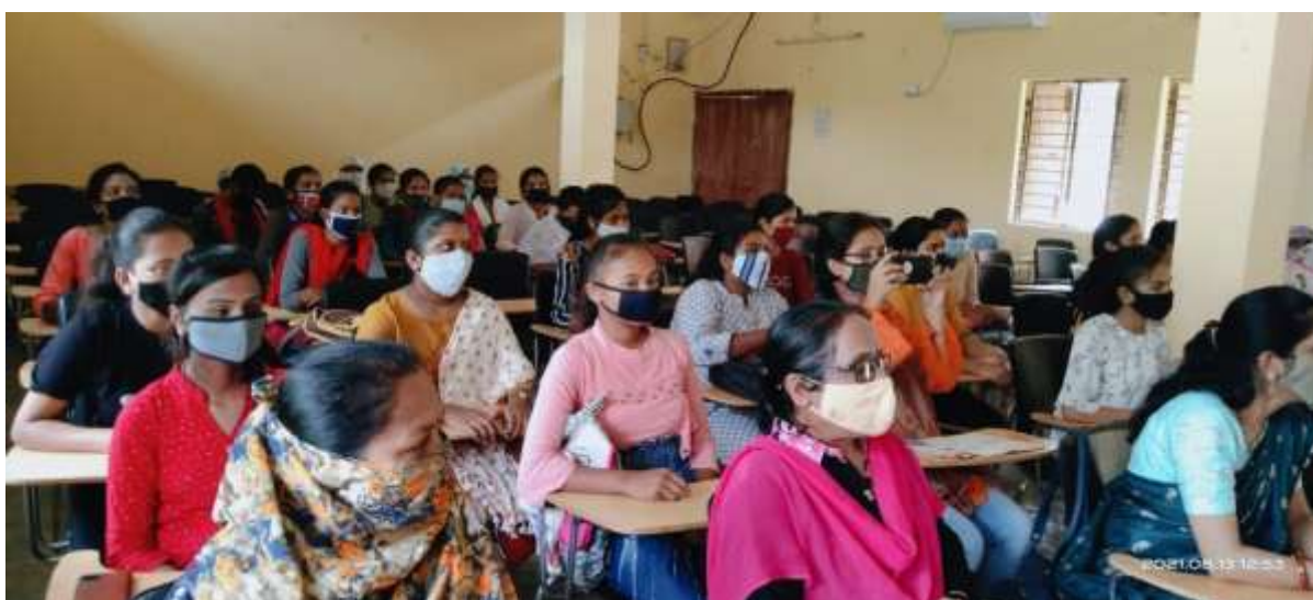
Fig.: Staff during the workshop on Awareness on Women Harassment.