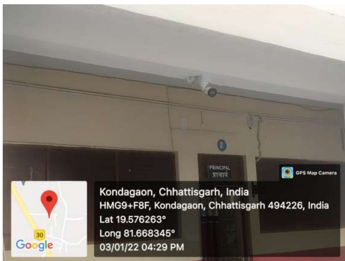
Fig.: CCTV camera in college building.